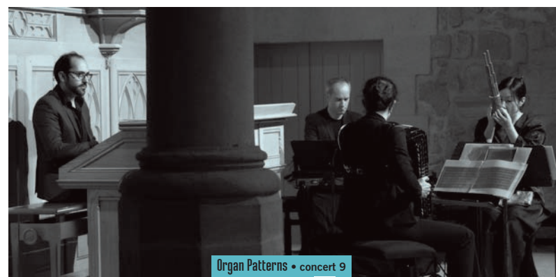
Organ Patterns • concert 9