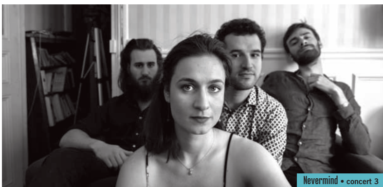
Nevermind • concert 3