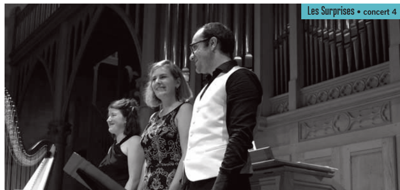
Les Surprises • concert 4